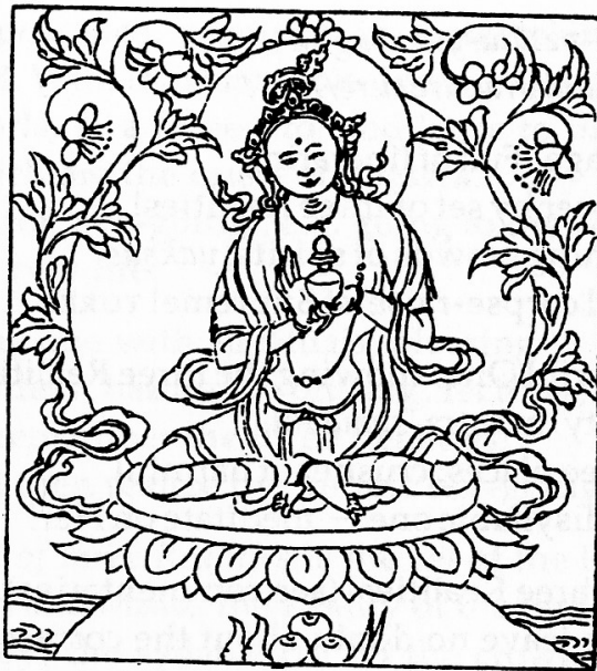
Tārā Source of All Attainments