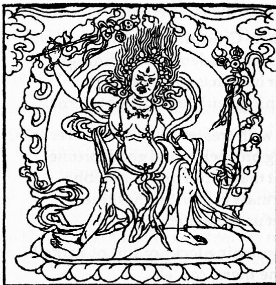
Tārā Summoner of All Beings, Dispeller of All Misfortune