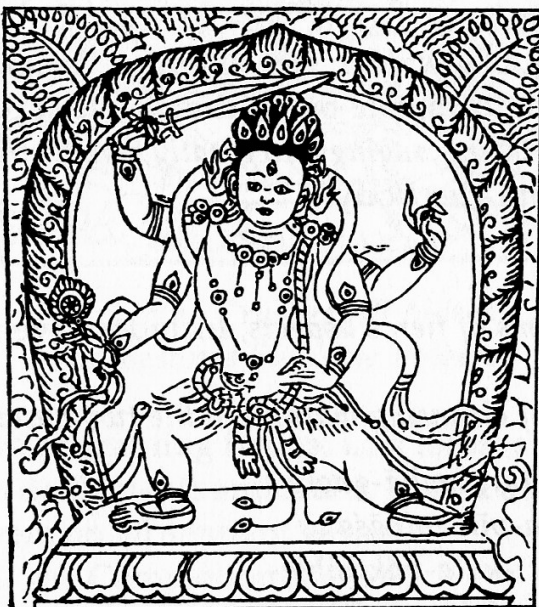
Tārā Crushing Adversaries

(6) 釈梵火天母(三界尊勝母) Tārā Victorious over the Three Worlds 部多鬼・起屍鬼を迷乱させる