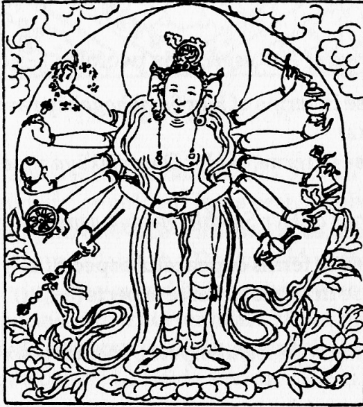
Tārā White as the Autumn Moon