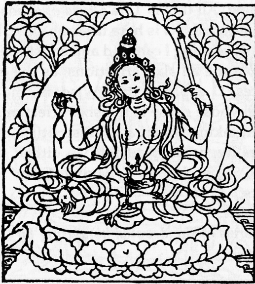
Tārā the Victorious Uṣṇīṣa of Tathāgatas