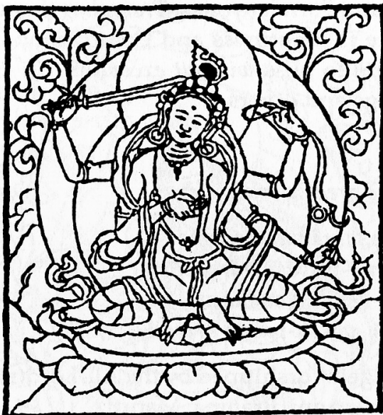
Tārā Victorious over the Three Worlds