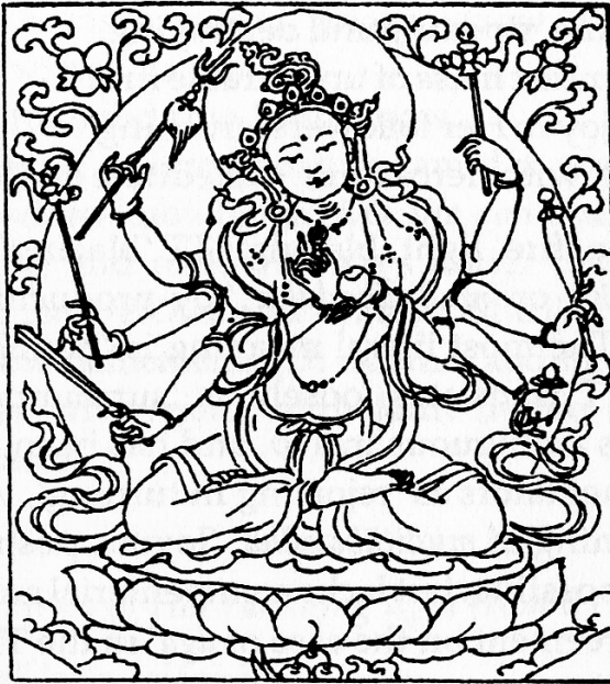
Tārā Giver of All Prosperity