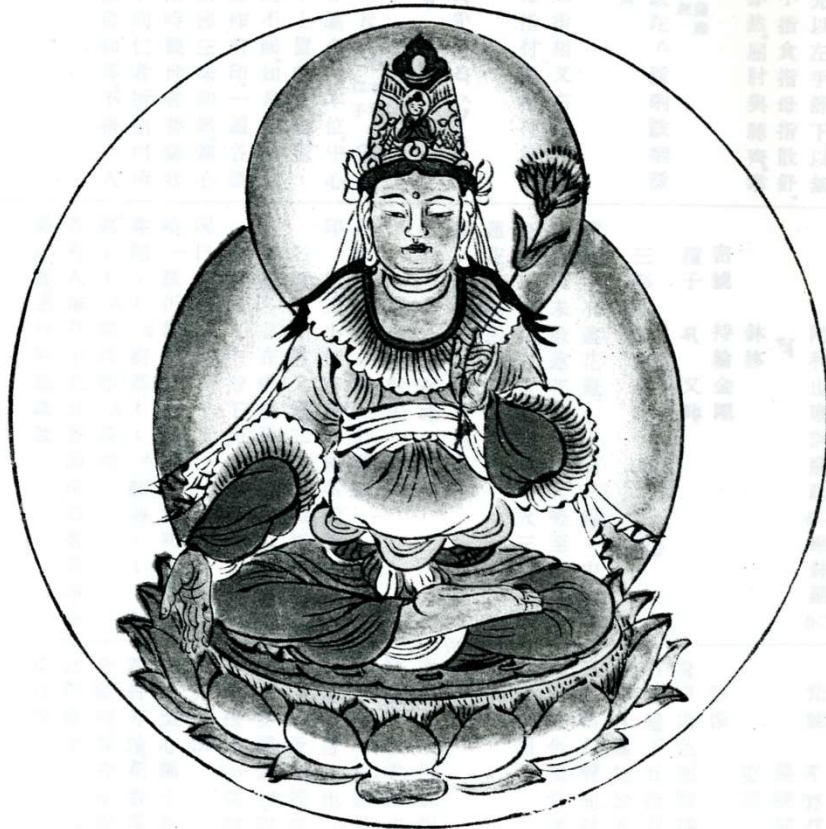
『図像抄』より 多羅菩薩 高野山圓通律寺蔵