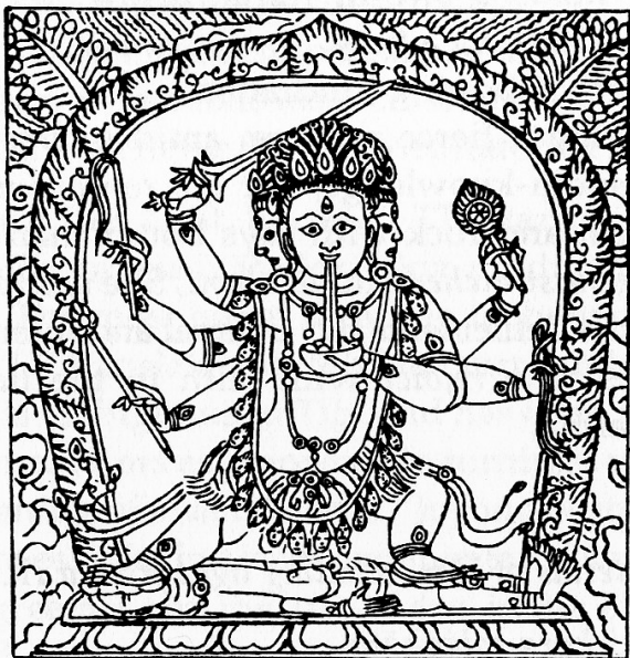
Tārā the Wrathful Summoner