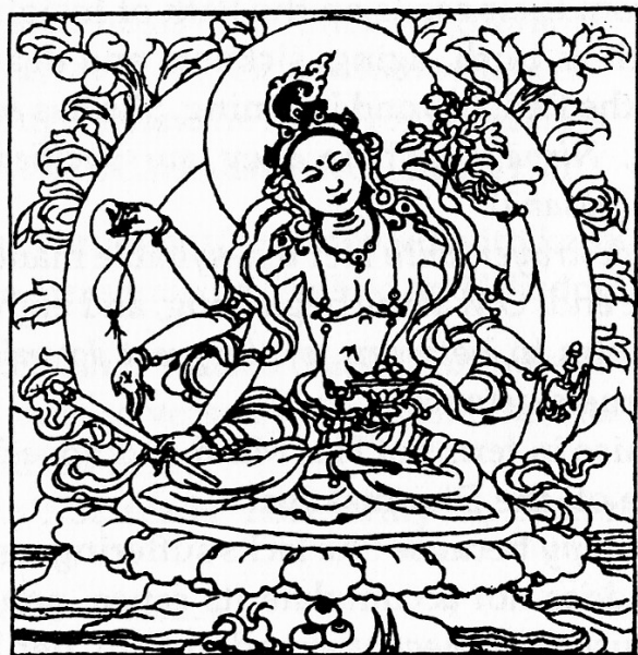
Tārā the Great Peaceful One