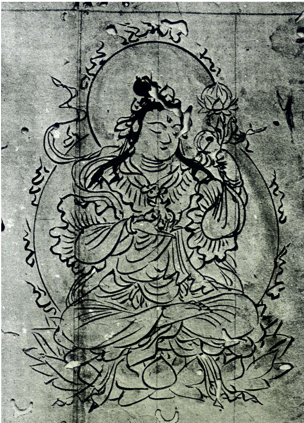
『覚禅鈔』(久原文庫本)より