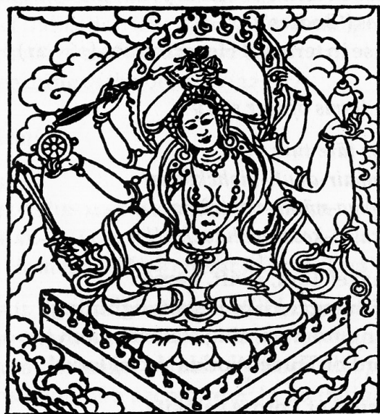
Tārā Swift and Heroic