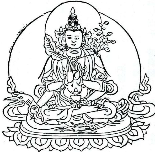
(18)薩囉天海母 Tārā the Victorious 毒病を除く