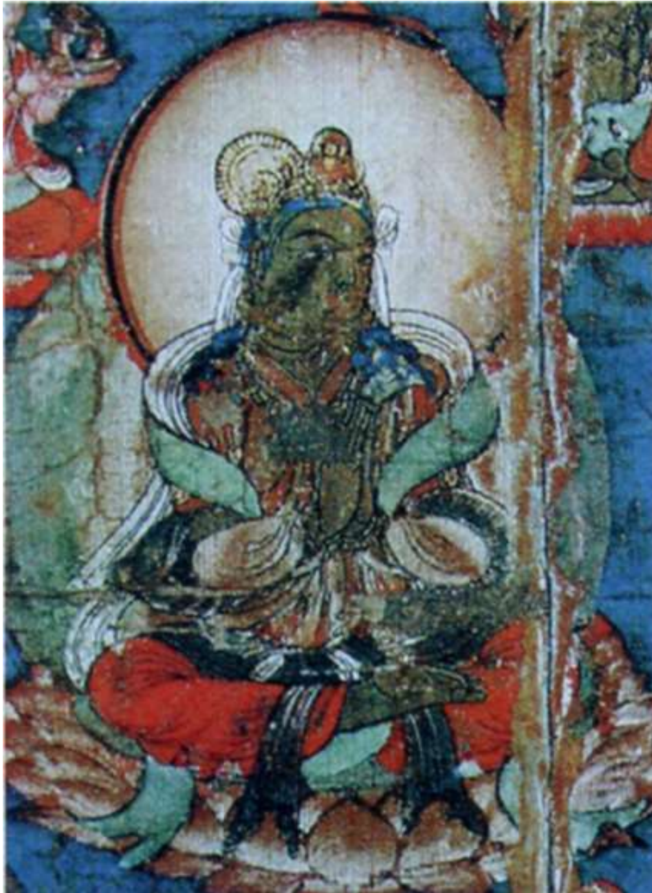
胎藏界曼荼羅(伝真言院) 多羅菩薩