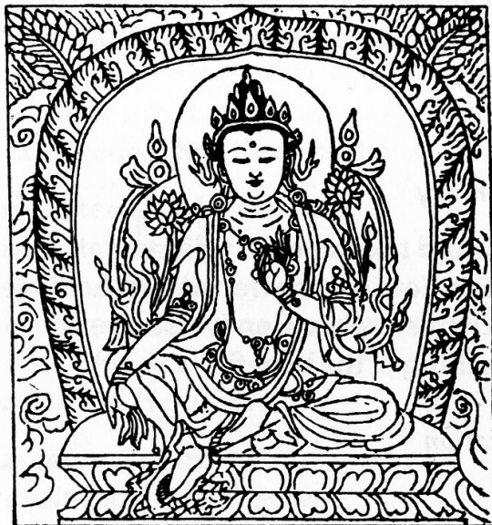
Green Tārā, from the Quadrilingual blockprint (Q)