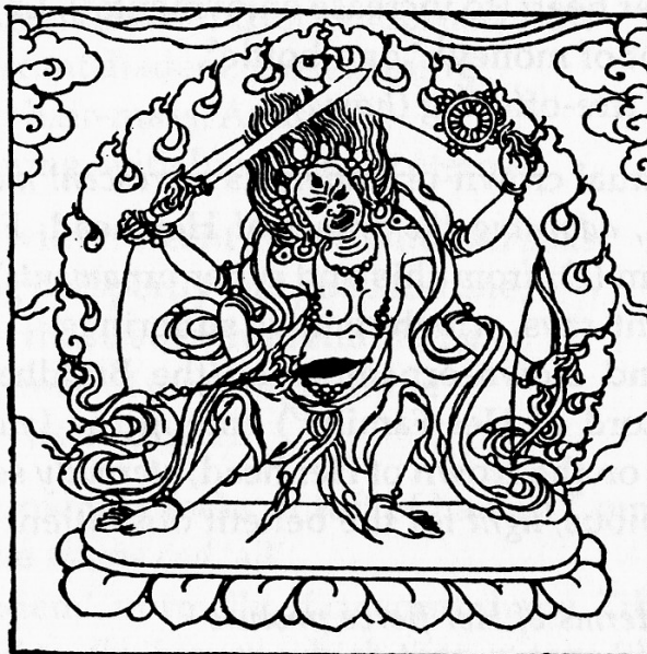
Tārā the Ripener