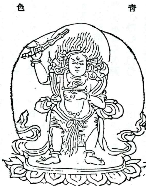
(11)守護衆地母 Tārā Summoner of All Beings, Dispeller of All Misfortune 貧困を救う