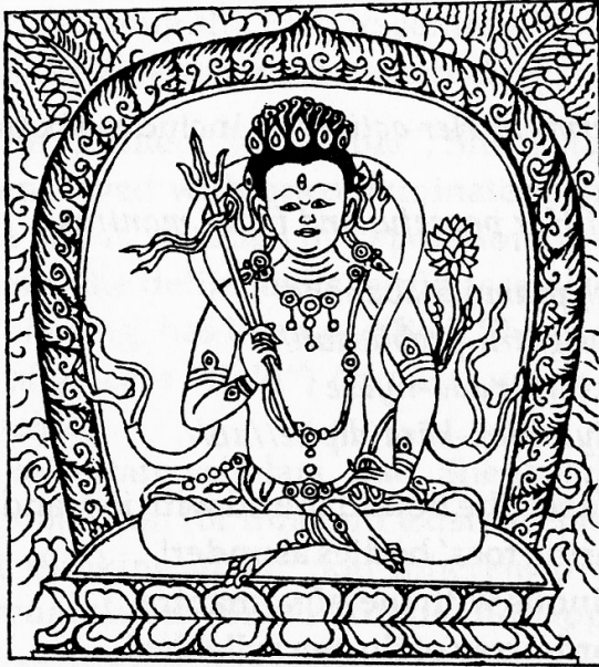
Tārā Destroyer of All Attachment