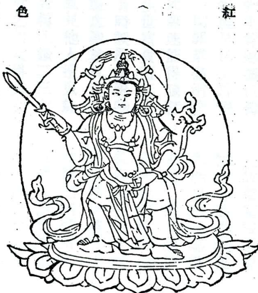
(10)威德歡悦母(降魔世間自在母) Tārā Dispelling All Sorrow 降魔