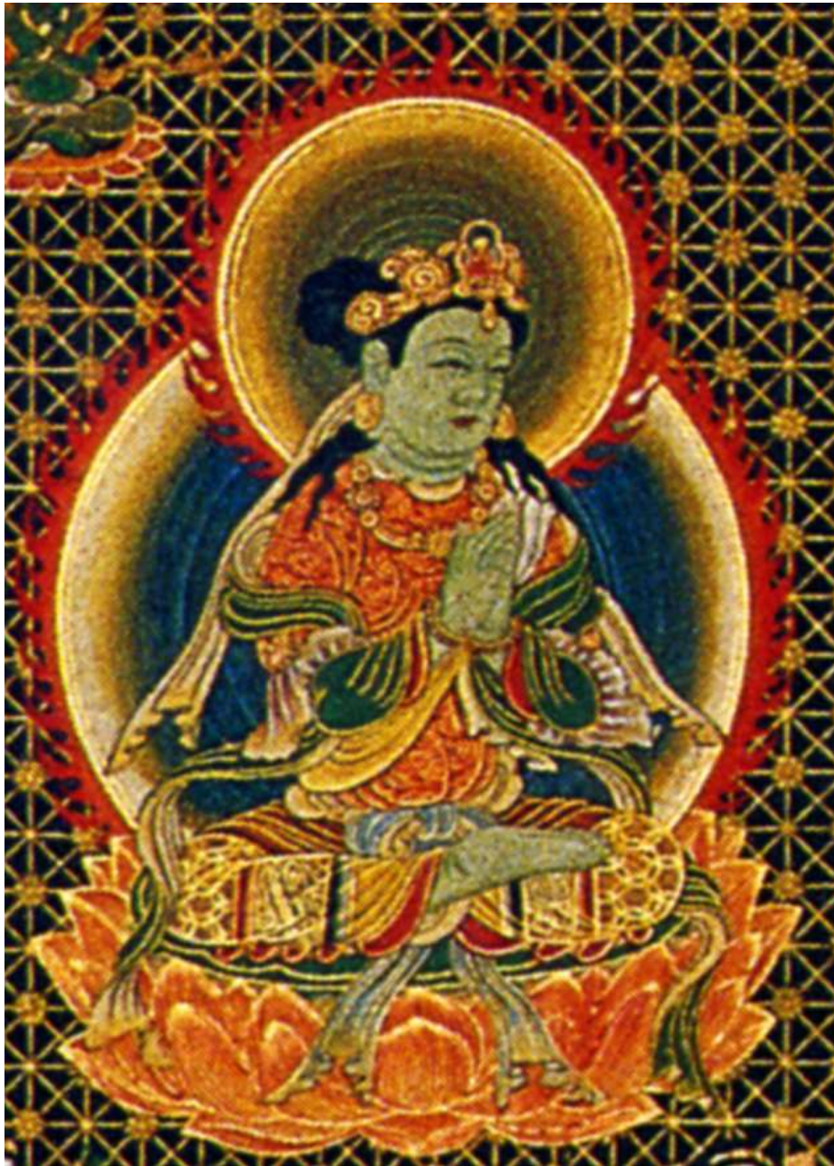
両界曼荼羅(元禄本) 胎蔵界・多羅菩薩