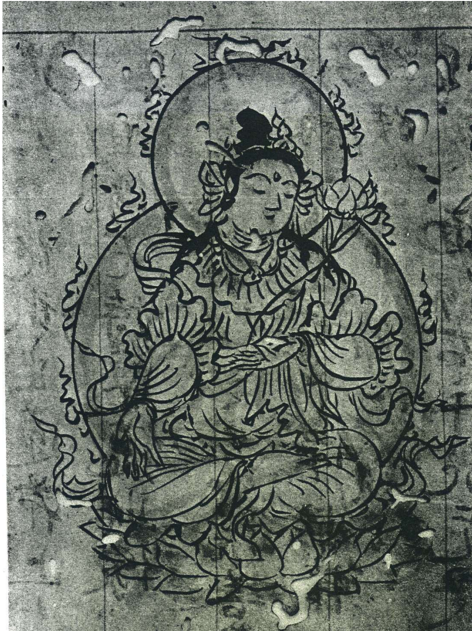
『覚禅鈔』(久原文庫本)より 多羅菩薩