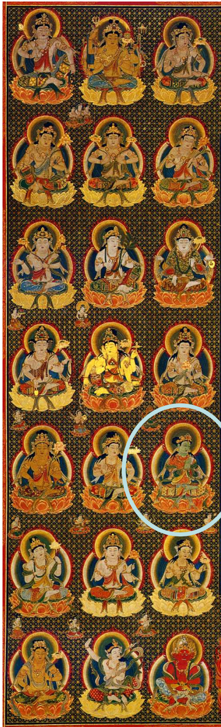
両界曼荼羅(元禄本) 胎蔵界・観音院