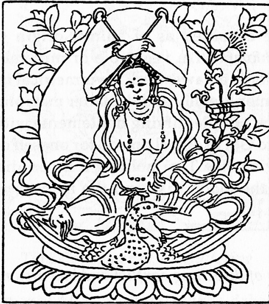
Tārā the Victorious