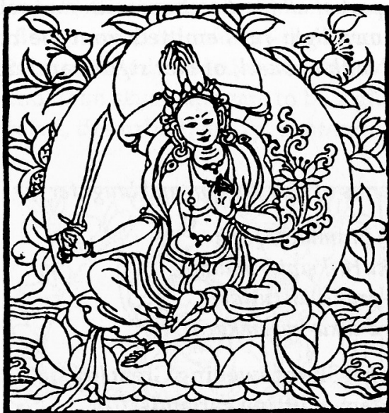
Tārā Dispelling All Sorrow