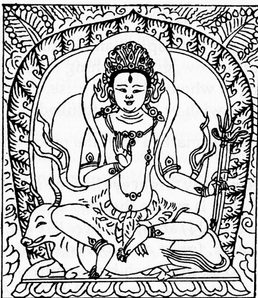
Tārā the Perfecter

(20) 日月広円母 Tārā Source of All Attainments 疫病を除く