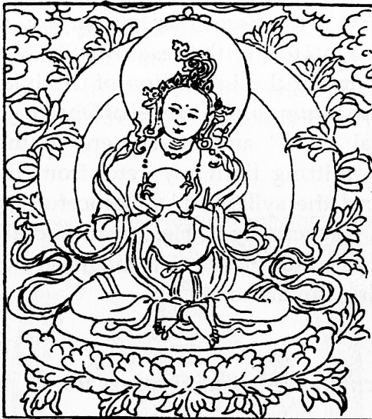
Tārā Accomplisher of All Bliss