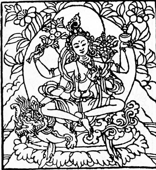
Tārā Who Crushes All Māras and Bestows Supreme Powers