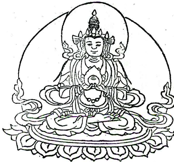
(19)諸天集会母 Tārā Consumer of All Suffering 煩惱を滅除する