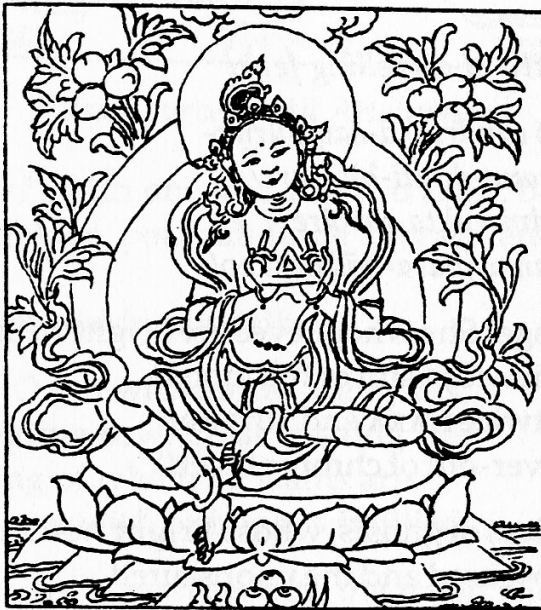
Tārā Consumer of All Suffering