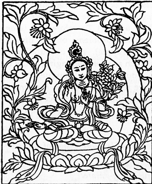
Tārā Proclaiming the Sound of HŪM

(4)如来頂髻母 Tārā the Victorious Uṣṇīṣa of Tathāgata 長寿