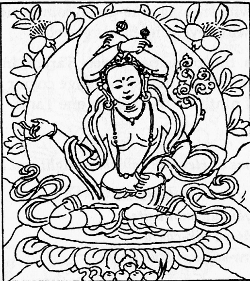
Tārā Granter of Boons

Tārā Who Crushes All Māras and Bestows Supreme Powers 降魔敵